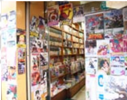
Yoshihiro Tatsumi's. The Push Man and Other Stories .

Pour ceux qui n'ont pas encore été touchés par la grande vague du manga ou celle de Kanagawa, voici quelques pistes pour vous mettre l'eau à la bouche : ses origines, ses codes, ses fondamentaux, les maîtres mangaka à connaître absolument et pour finir et pour les déjà fans invétérés, quelques news et évènements à venir.